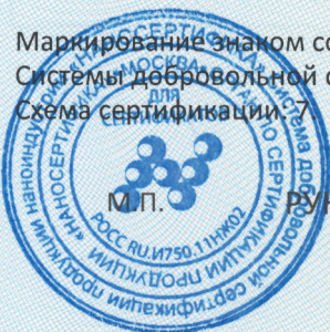
Схема сертификации: 7

Маркирование знаком соответствия производится на основании «Порядка применения знака соответствия Системы добровольной сертификации продукции «НАНОСЕРТИФИКА».